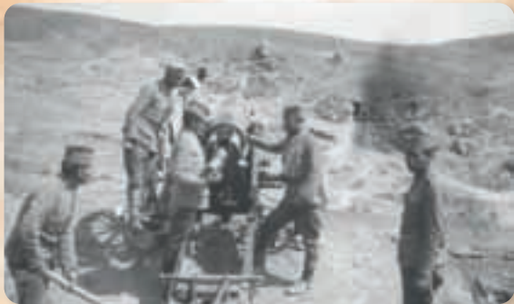
Дејство српске артиљерије, 14. септембар 1914.