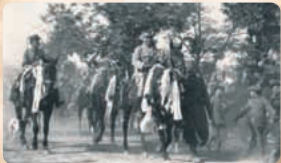
Француске трупе улазе у ослобођени Пожаревац, 16 (29.) октобар 1918. Војни музеј, Збирка фотографија, Р-2519