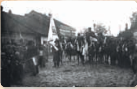
Окићени ослободиоци Пожаревца, 16 (29.) октобар 1918.