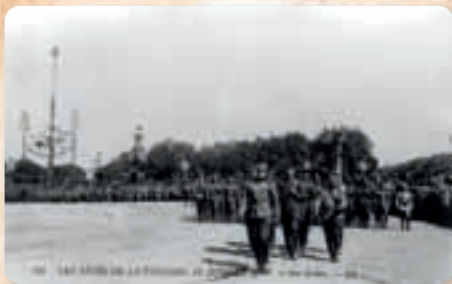
Дефиле српске војске на Паради победе у Паризу, 14. јул 1919.