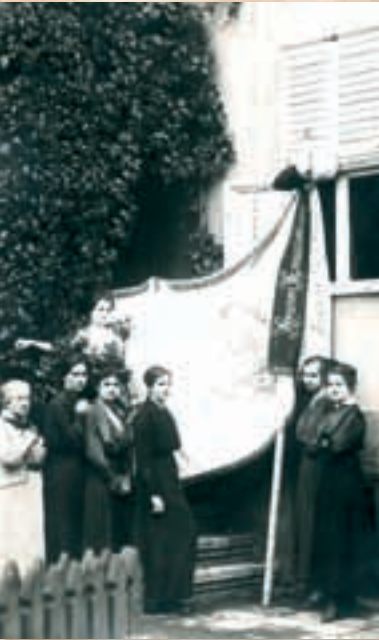
Везиље - чланице Кола српских сестара из Пожаревца поред заставе коју су израдиле и предале ослободиоцима Пожаревца 16 (29.) октобра 1918.