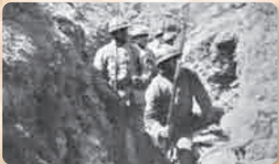
Српска пешадија креће у пробој, септембар 1915.