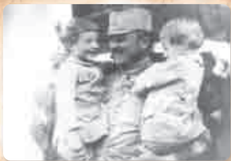
Повратак ратника кући