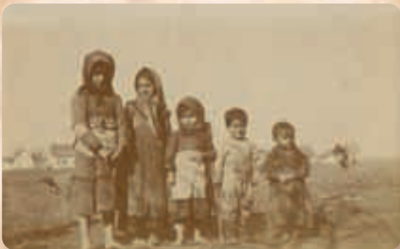
Рат је прекинуо детињство