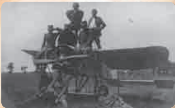
Школа за обуку pilota и извиђача, Пожаревац 1915.