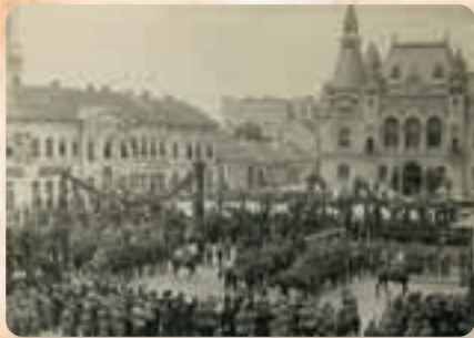
Свечаности у ослобођеним градовима Србије, 1918.