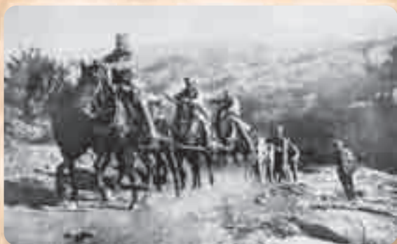
Пољска артиљерија мења положај